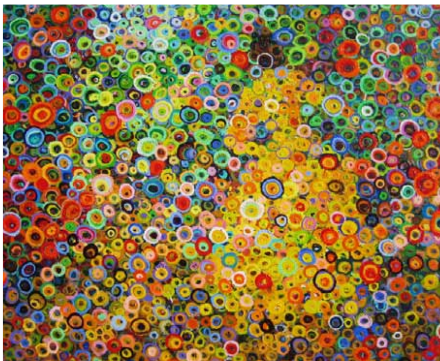
Marcio Diaz, Women in the garden

RÉSEAU D'ÎLE-DE-FRANCE D'HÉMATOLOGIE-ONCOLOGIE PÉDIATRIQUE